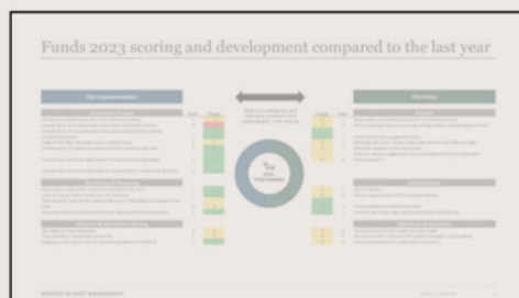
Rahaston kysymyskohtainen pisteytys ja kehitys edellisvuodesta

Räätälöity analyysi mahdollistaa kattavan arvioinnin eri näkökulmista. Managerin kohderahaston ESG-suoriutumista arvioidaan sekä yleisesti muihin rahastoihin verrattuna että maantieteellisesti (PD-managerit, Eurooppa vs. Yhdysvallat). Suoriutumista arvioidaan kuluvan ja edellisen vuoden osalta sekä vertailukohteisiin nähden. Lopuksi manageri saa yksityiskohtaiset tiedot siitä, miten se on suoriutunut kysymyskohtaisesti, ja siitä, miten rahasto on kehittynyt verrattuna edellisvuoteen. Kysymykset kohdistuvat sekä manageriin että kohderahastoon. Näin ollen palaute muodostaa kattavan kuvan siitä, miten managerin ESG-suorituskyky vertautuu koko Mandatum PD- tai ERE-sijoitusuniversumiin ja erityisesti managerin omiin keskeisiin verrokkeihin samassa alasegmentissä.