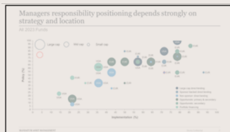
Managerin rahaston ESG-performanssi verrattuna muihin kohderahastoihin