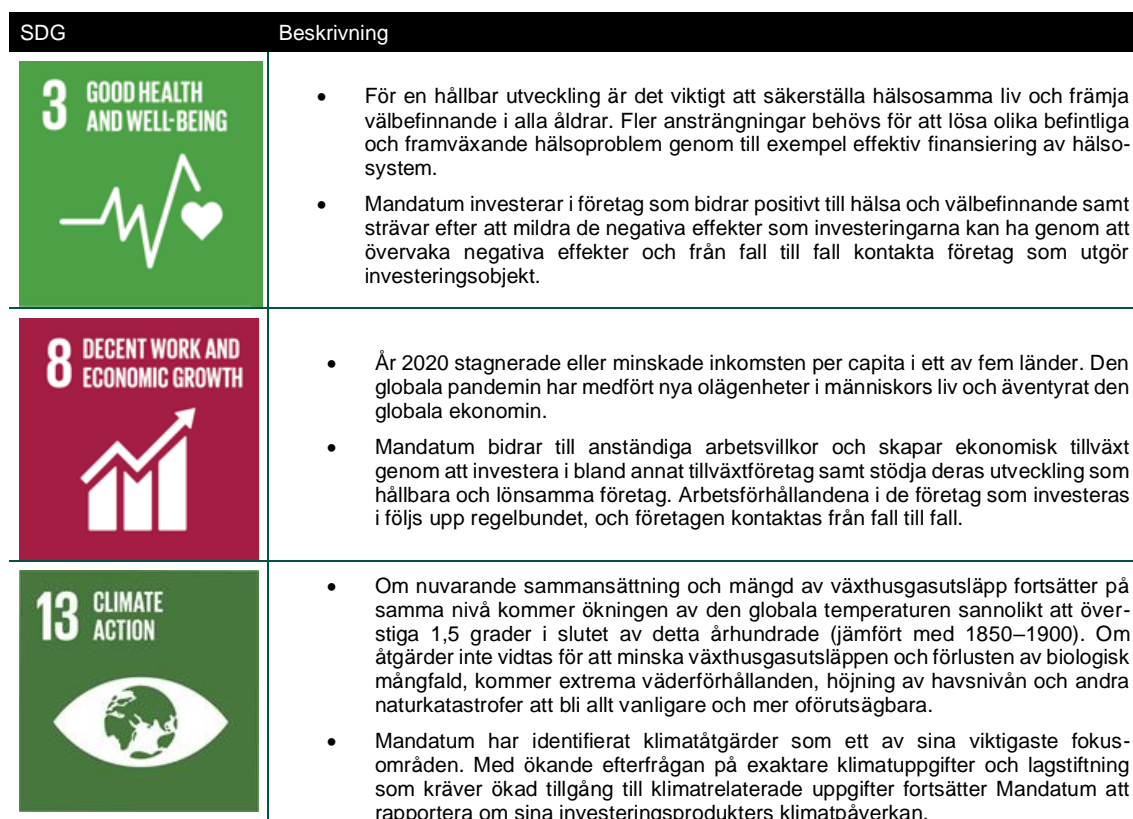
Tabell 2. FN:s mål för hållbar utveckling och beskrivningar.

Mandatum erkänner vikten av att tillämpa FN:s globala mål för hållbar utveckling (SDG) som ett verktyg för att styra investeringsprocessen. Mandatumkoncernen har fastställt följande SDG-mål som mest relevanta för sin verksamhet. Mandatums portföljförvaltning strävar efter att bidra positivt till dessa mål (beskrivs mer i detalj i tabell 2).